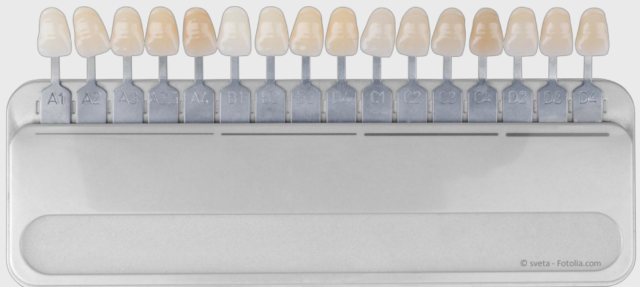
Farbskala zur Bleaching-Kontrolle

Wenn wir es machen, um bis zu neun Farb-stufen . Das kann man ziemlich genau mit einer sog. Farbskala messen (siehe Foto). Frei verkäufliche Aufheller aus dem Internet oder Drogeriemarkt schaffen das meistens nicht.