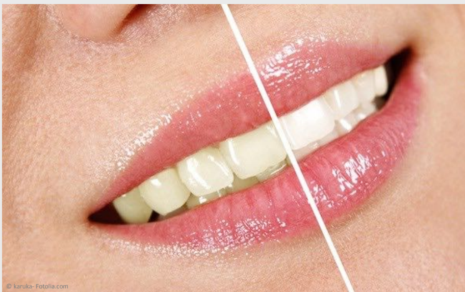
Deutlicher Unterschied: Professionelles Bleaching beim Zahnarzt wirkt!

Vertrauen Sie Ihre Zähne besser Profis an!