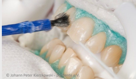
Power-Bleaching beim Zahnarzt: Auftragen des Bleaching-Gels

Wenn Sie die Praxis wieder verlassen, können Sie sich an sichtbar helleren Zähnen freuen!