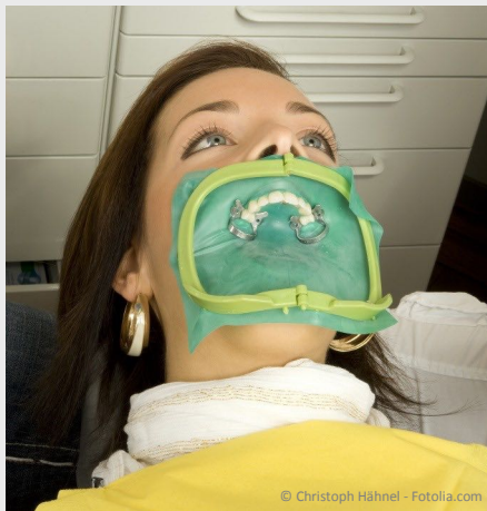
Kofferdam (Spanngummi) zum Schutz vor Bakterien

Die Keimfreiheit bei der Wurzelbehandlung ist eine der wichtigsten Voraussetzungen für den langfristigen Erfolg.