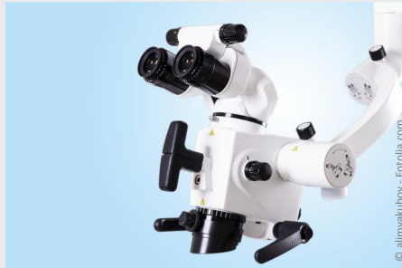
Wurzelbehandlung mit Hilfe des Mikroskops: Bis zu 25-fache Vergrößerung ermöglicht exakteres Arbeiten und bessere Ergebnisse.

Wurzelkanäle sind nur wenige Zehntelmillimeter dünn. Sie können Verästelungen, Krümmungen oder Stufen haben. Mit bloßem Auge sind solche Feinheiten nicht erkennbar. Deshalb werden sie leider oft übersehen.